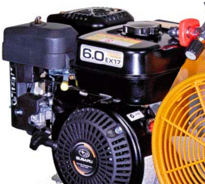
Version moteur essence