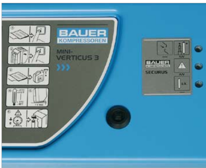
Система контроля SECURUS – идеально интегрирована в корпус