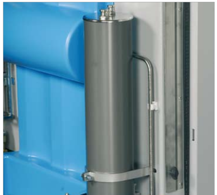
Фильтрующая система P41: замена картриджа за одну минуту